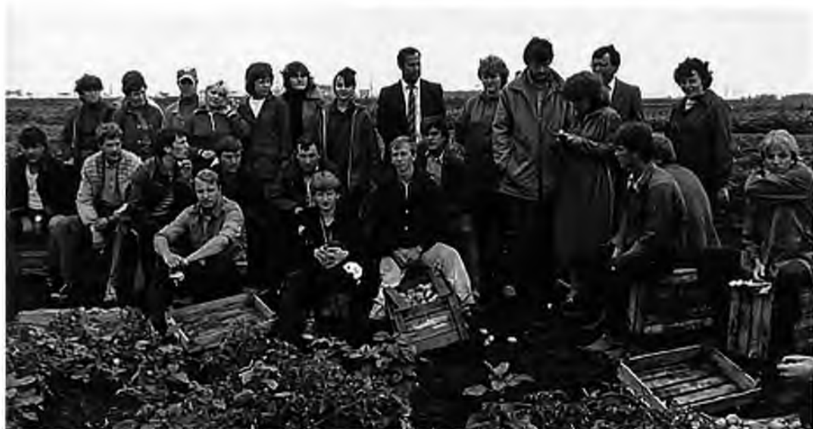
Первым под своё шефство агрегатчики взяли совхоз имени Луначарского в Ставропольском районе