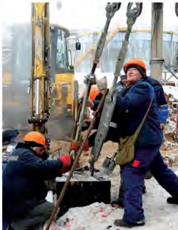
В кадре – перенос опоры для дымовой трубы котла