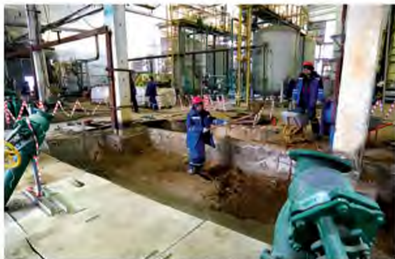
В корпусе №507 ремонтируют дренажные каналы

В ближайшее время подрядчики, которым помогает персонал производства карбамида, начнут монтировать бак воды объемом 1000 кубометров, – началась заливка фундамента. В конце марта стартует монтаж технологического оборудования – фильтров и емкостного оборудования.