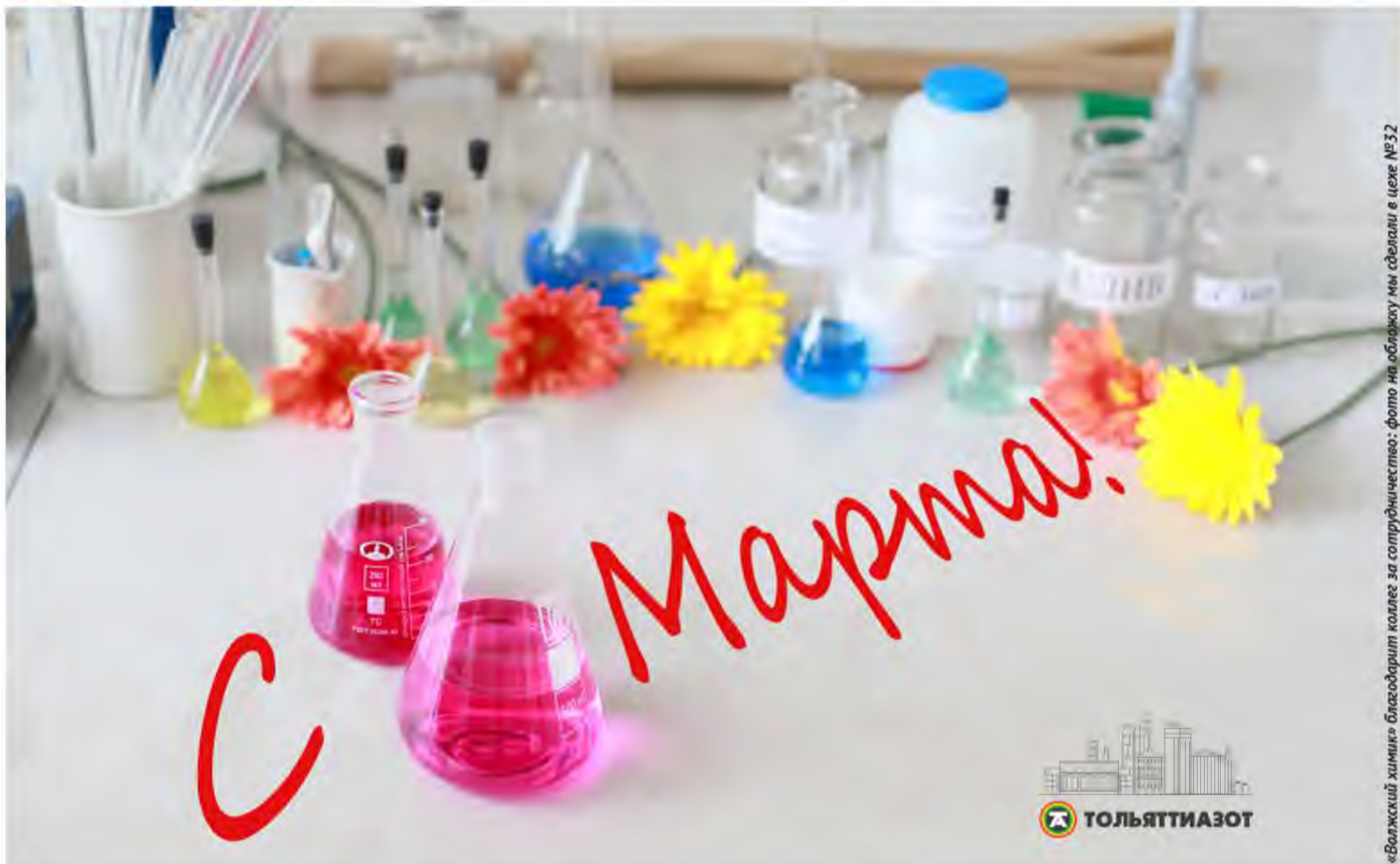
«Волжский химик» благодарит коллег за сотрудничество: фото на обложку мы сделали в цехе №32