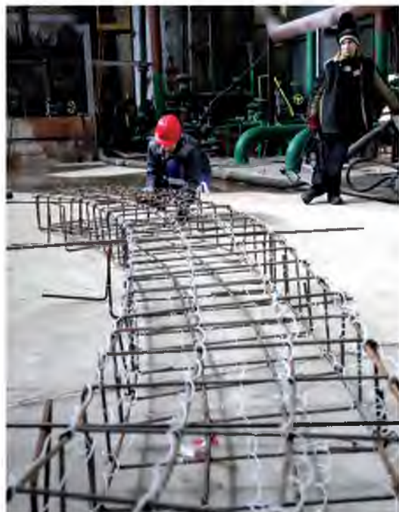
Идёт обвязка арматуры для каркаса пола