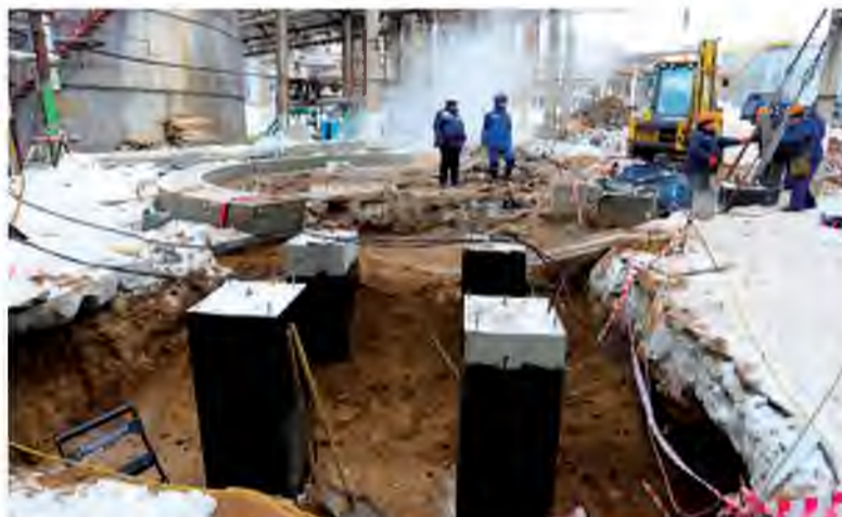
Будущий фундамент предназначен для бака исходной воды